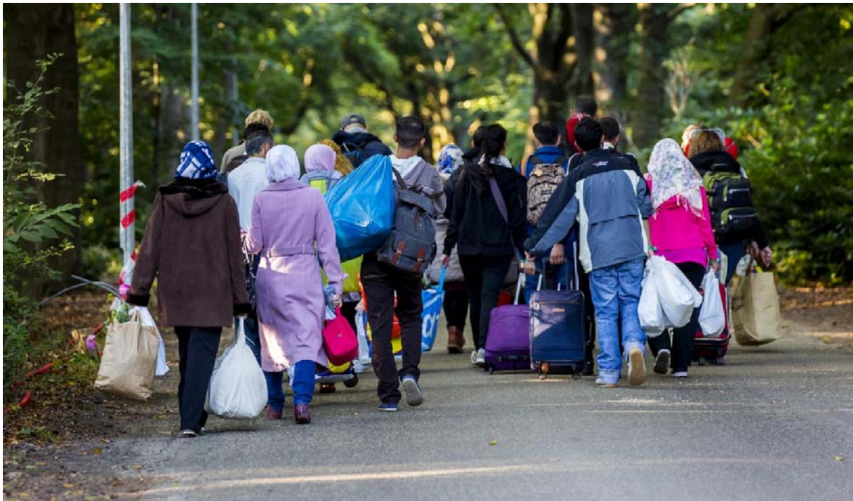
Asielzoekers in Heumensoord bij Nijmegen

Mocht de oorlog binnen die vijf jaar voorbij blijken te zijn, dan zullen de Syriërs weer naar hun land terug moeten gaan.