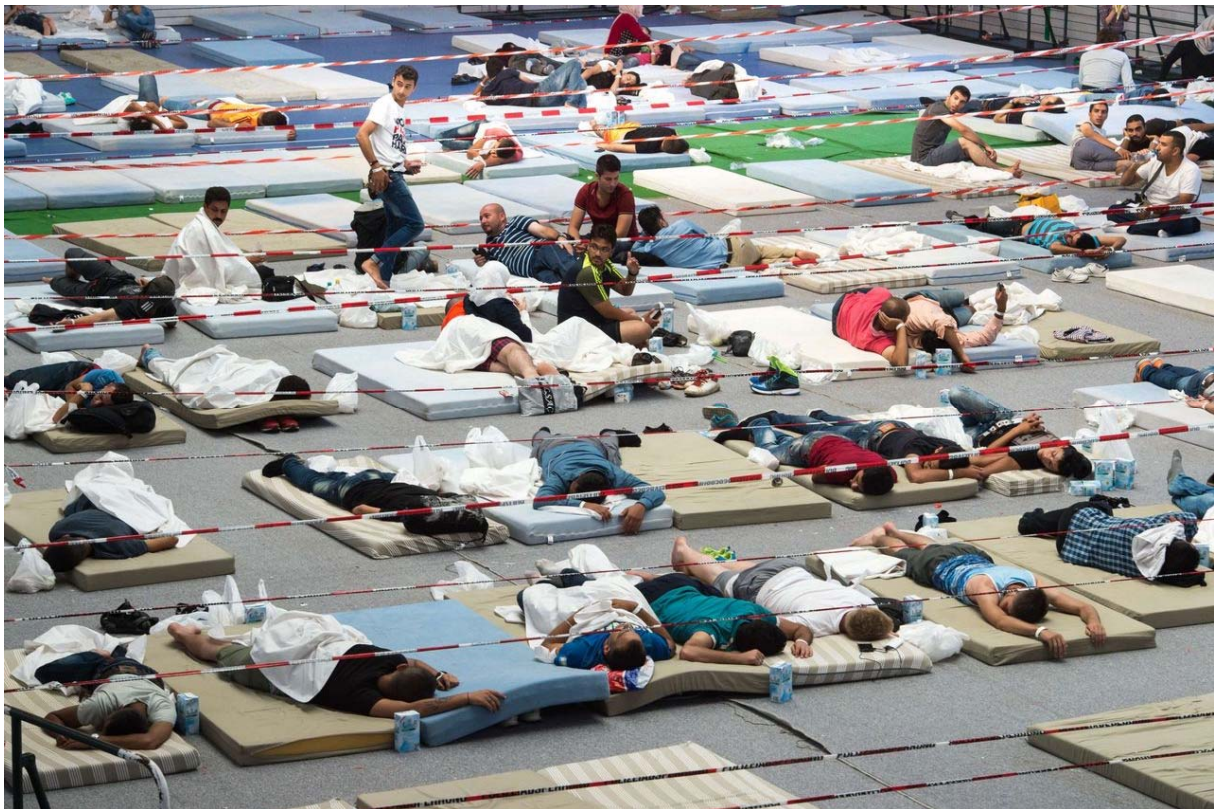
Opvang in een sporthal in Deggendorf (in Zuid-Duitsland)

Vooraf in Duitsland en in Nederland en in mindere mate Zweden klagen veel burgers dat hun land ontwricht worden als er nog meer vluchtelingen hun kant op komen. In oktober klaagden 200 Duitse burgemeesters dat er geen vluchtelingen meer bij kon.