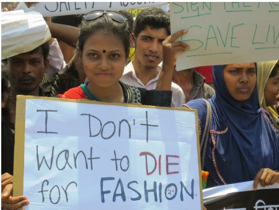
Protesten van textielarbeiders na het instorten van Rana Plaza

De kleren die wij dragen vormden een directe link tussen ons hier en de omgekomen mensen daar. Tussen het puin werden labels gevonden van merken als C&A, Primark en Benetton. Ineens werd duidelijk wie de werkelijke prijs voor onze goedkope kleding moet betalen. Rana Plaza werd het symbool voor wantoestanden in de kledingindustrie: lage lonen, lange werkdagen, geen vakbondsvrijheid en onveilige werkomstandigheden.