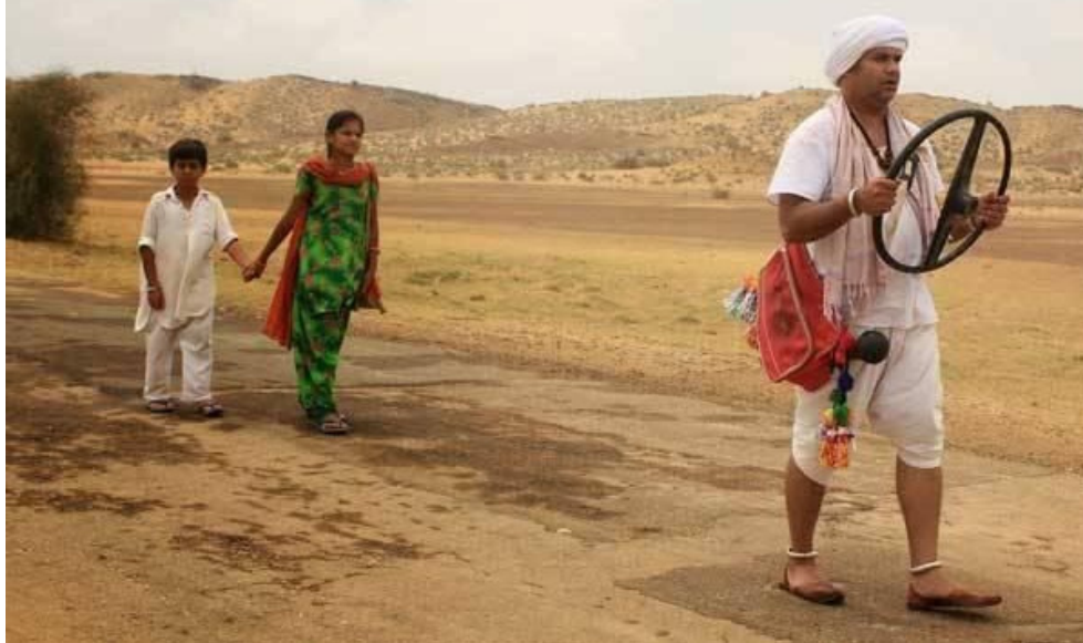
Chotu, Pari en de 'vreemde man'

Waar ging de film Rainbow ook al weer over?