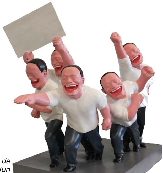
Een kunstwerk van de Chinese kunstenaar Yue Minjun