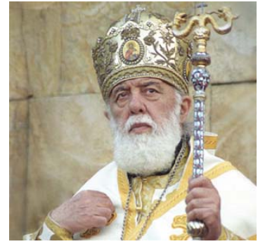
Patriarch Illia II

Godsdienstvrijheid is vastgelegd in de Georgische wet en wordt over het algemeen gerespecteerd door de overheid. Maar de Georgische-Orthodoxe Kerk heeft veel privileges ten opzichte van de andere religies. Leaders van de deze kerk vallen regelmatig religieuze minderheden aan en verstoren hun religieuze activiteiten. De regering van Georgië heeft meermalen de leaders van de Georgische-Orthodoxe Kerk opgeroepen om daarmee te stoppen, zonder veel resultaat.