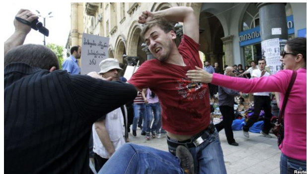
Een LHBT-rechtenactivist botst met een Georgisch-Orthodoxe activist in Tbilisi op 17 mei

Elk jaar op 17 mei komen LHBT-ers en mensen die de Georgisch-Orthodoxe Kerk steunen tegenover elkaar te staan. Vasadze legt de schuld geheel bij de LHBT-gemeenschap. Hij zei daarover: "Stop met deze gekte. Stop met het financieren van de honderden organisaties die onze kerk en onze families aanvallen."