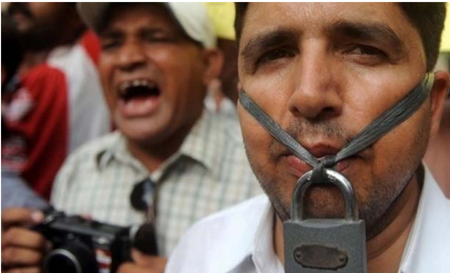
Protest tegen de inperkingen van de vrijheid van meningsuiting

Volgens de Pakistaanse grondwet is de vrijheid van meningsuiting onderworpen aan 'redelijke wettelijke beperkingen in het belang van de glorie van de islam'. Deze beperkingen brengen bijvoorbeeld met zich mee dat het niet is toegestaan in negatieve zin over de islam en zijn profeten te spreken of te schrijven. Jaarlijks worden talloze mensen -vaak alleen op basis van een (mondelijke) beschuldiging- gearresteerd en aangeklaagd.