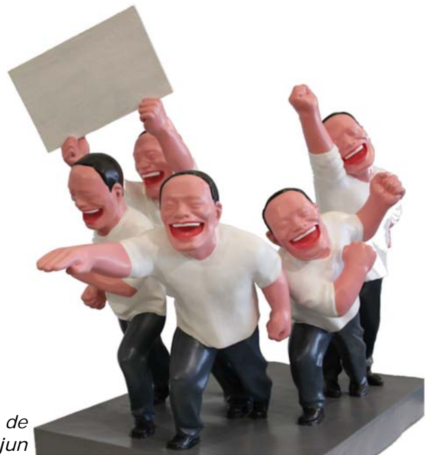
Een kunstwerk van de Chinese kunstenaar Yue Minjun