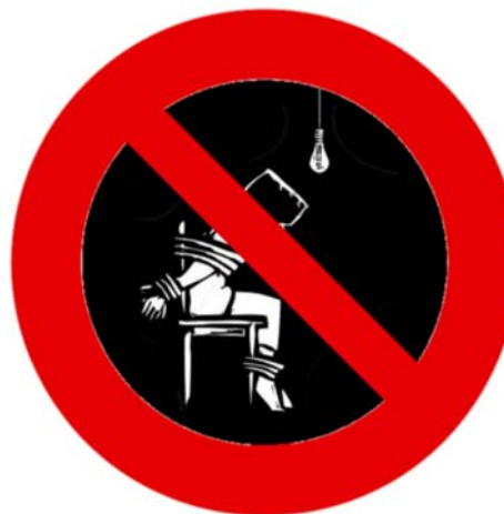
Verboden te martelen