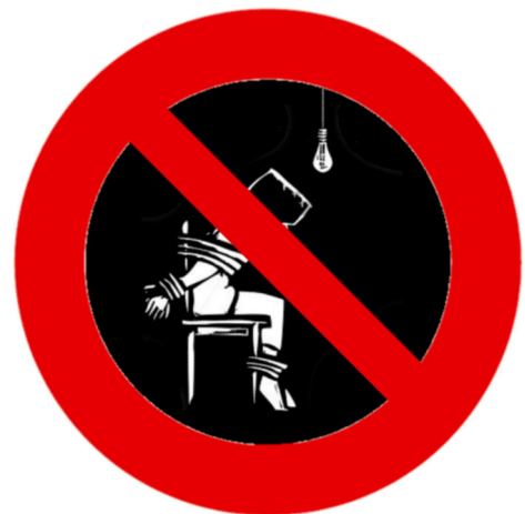
Verboden te martelen