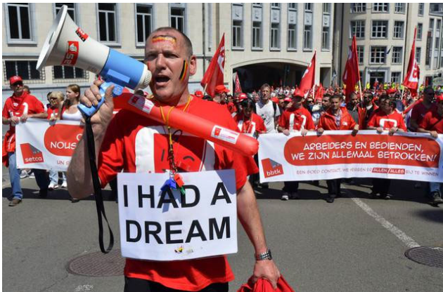
Demonstratie van de vakbond in België