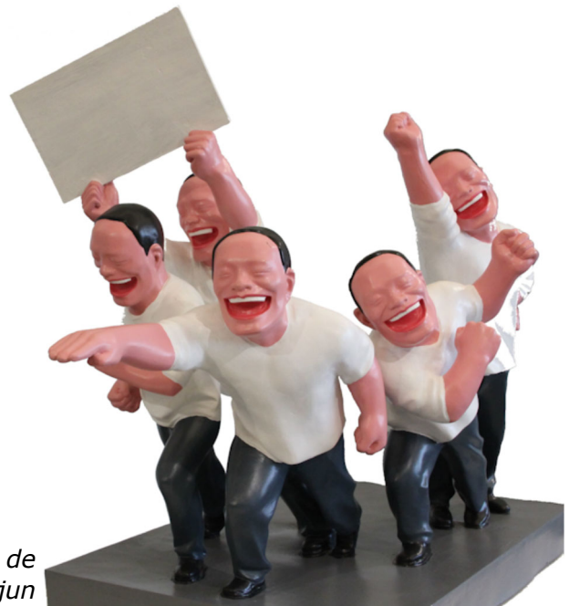
Een kunstwerk van de Chinese kunstenaar Yue Minjun