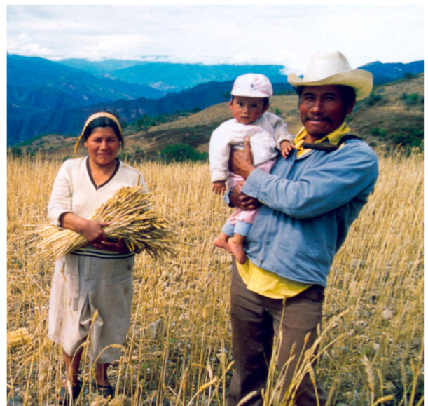
Een inheemse boerenfamilie

Er zijn de afgelopen jaren wel verbeteringen gebracht, maar nog steeds worden mensen van inheemse afkomst aan alle kanten gediscrimineerd.