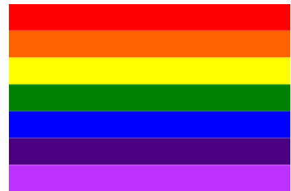
Boven: de regenboogvlag, de vlag van LHBT+ers

In Rusland is het strikt verboden om een met een regenboogvlag te wapperen vanwege de strenge anti-homowetgeving. Activisten hebben die wet stiekem omzeild met een slimme truc tijdens de Wereldcup Voetbal 2018 in Rusland. De zes T-shirt dragers dragen de voetbalkleur van hun eigen land; ze komen uit Spanje, Nederland, Brazilië, Mexico, Argentinië en Colombia.