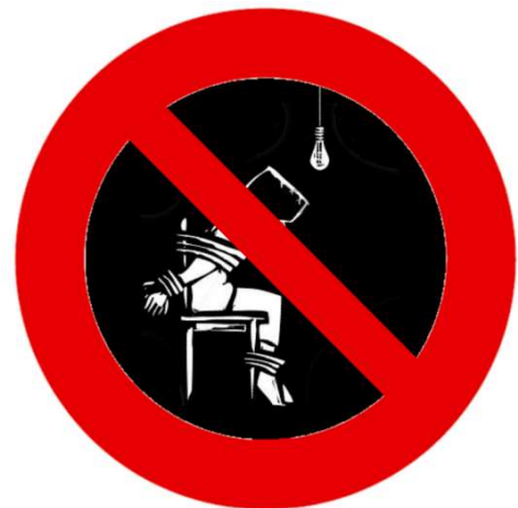
Verboden te martelen