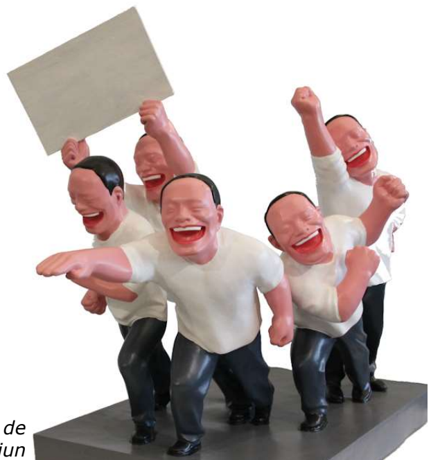
Een kunstwerk van de Chinese kunstenaar Yue Minjun