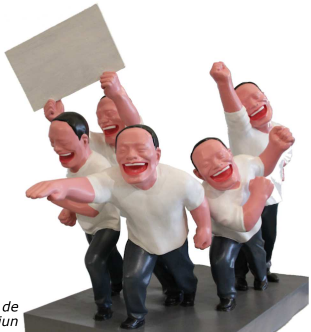
Een kunstwerk van de Chinese kunstenaar Yue Minjun