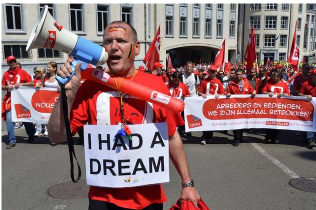
Demonstratie van de vakbond in België